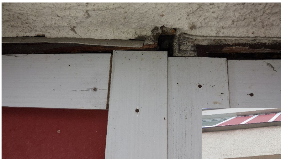
Obr. č. 4 – Kolem vyplní meziokenních nik je několik vhodných úkrytů.