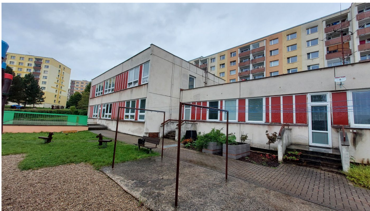
Obr. č. 2 – Pohled na posuzovaný objekt od jihu.