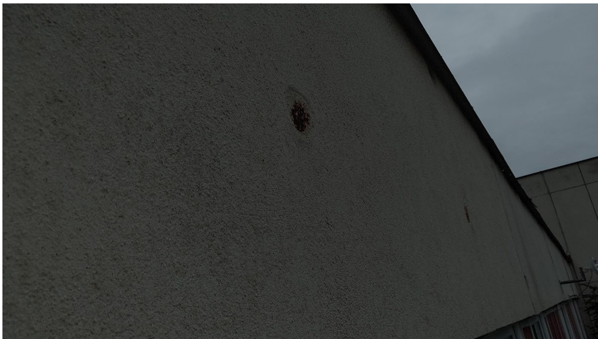
Obr. č. 3 – Otvory v atice jsou opatřeny funkční mřížkou.