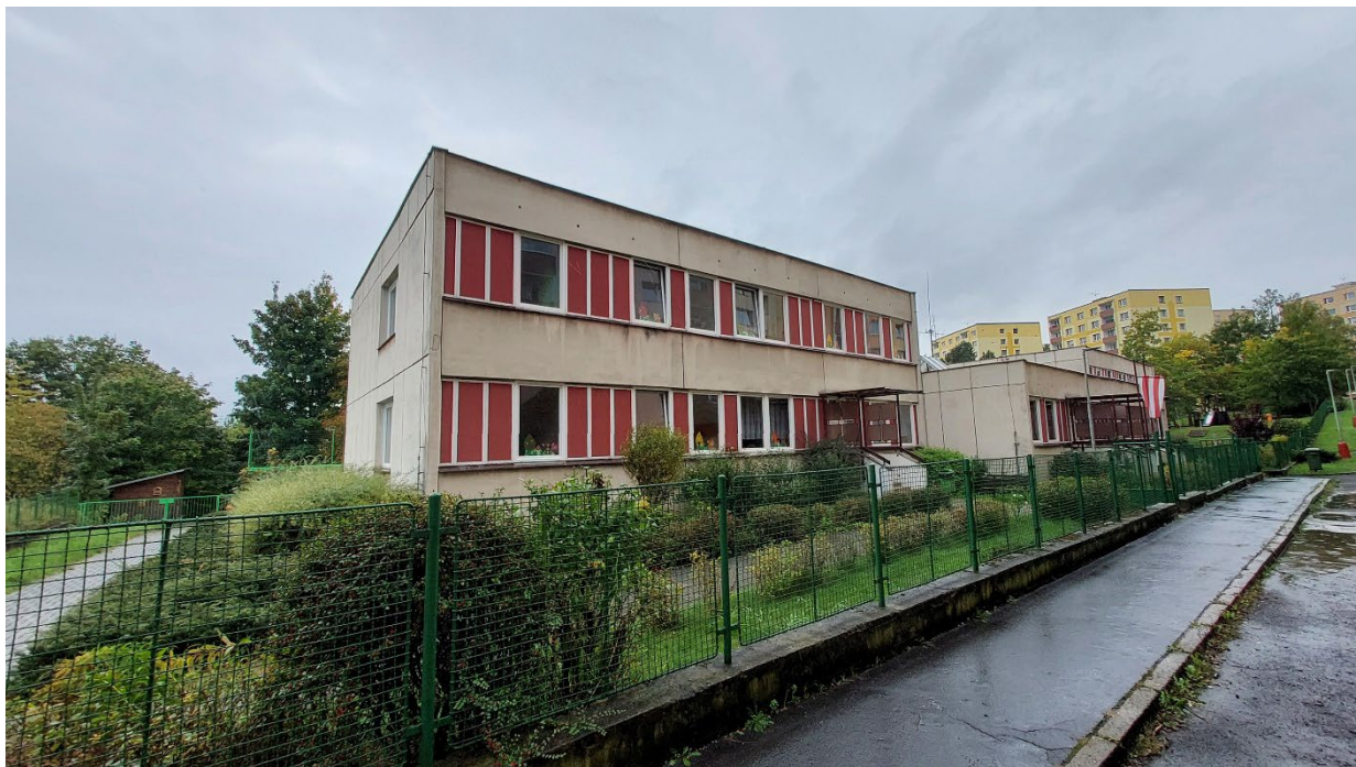
Obr. č. 1 – Pohled na posuzovaný objekt od severovýchodu.